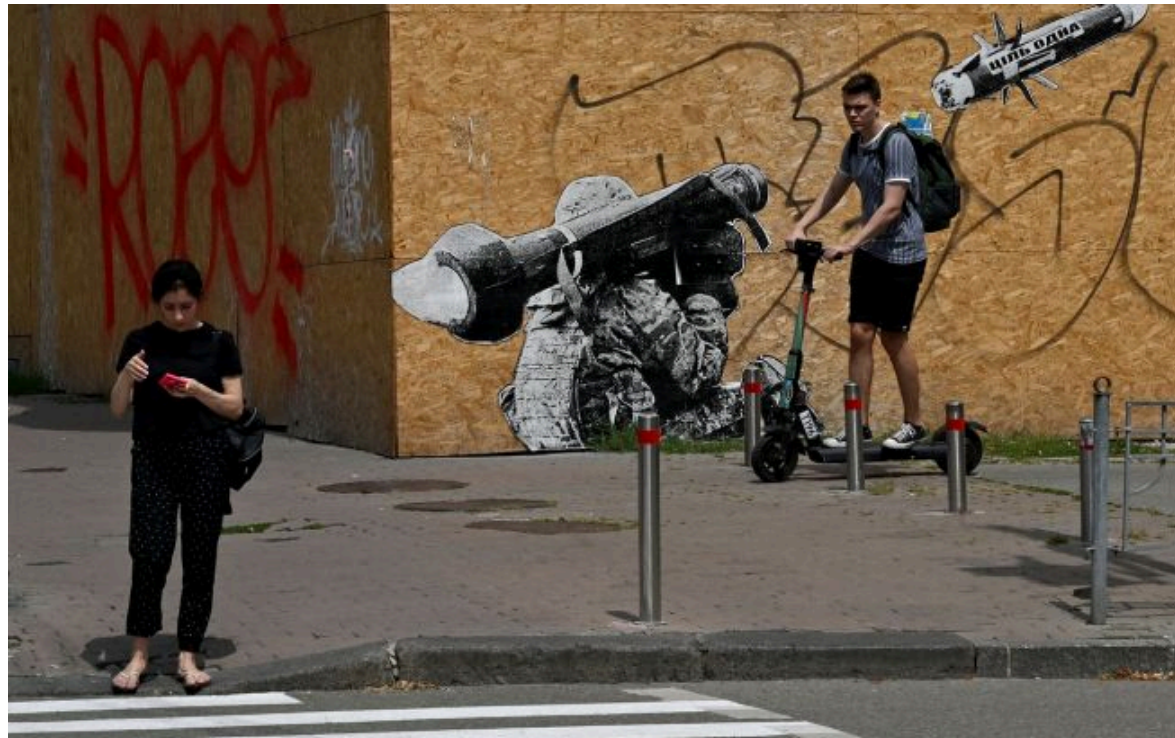
Фото: для власників електросамокатів введуть правила