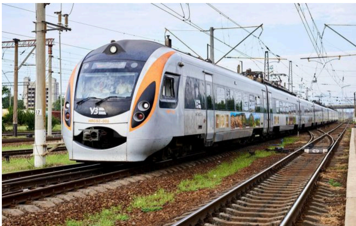
Фото: Укрзалізниця вперше запустить "Інтерсіті" сполученням Дніпро - Одеса (facebook.com/Ukrzaliznytsia)