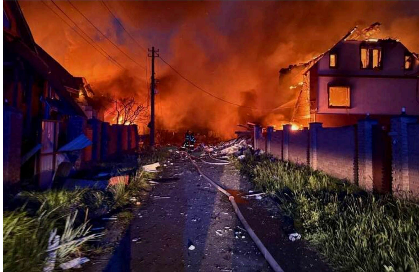
Нічна атака РФ: 13 загиблих і понад 50 поранених по всій Україні, – Гетманцев

Читати на руськом Read in English Додати як бажане джерело в Google