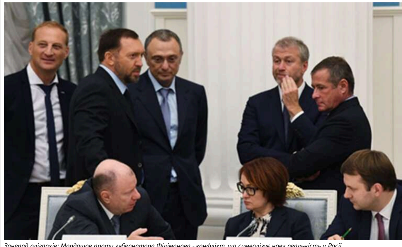
Занепад олігархів: Мордашов проти губернатора Філімонова - конфлікт, що символізує нову реальність у Росії

Один із найбагатших росіян Олексій Мордашов зіштовхнувся з неочікуваним спротивом від влади Вологодської області, де знаходиться його металургійний гігант "Северсталь". Конфлікт з губернатором Георгієм Філімоновим демонструє зменшення впливу російських мільярдерів – процес, що значно прискорився після вторгнення Росії в Україну.