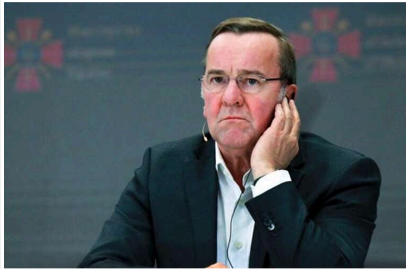
Пісторіус: Найближчим часом ядерна парасолька США для Європи не може бути замінена

Міністр оборони Німеччини Борис Пісторіус сказав, що наразі немає альтернативи американському ядерному щиту для Європи.