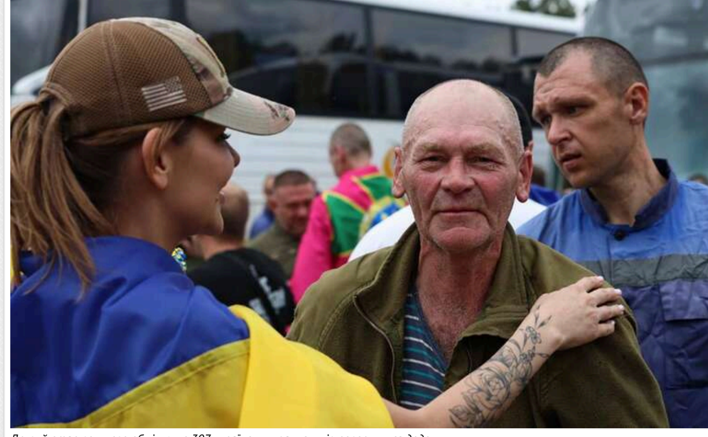
Другий етап великого обміну: ще 307 українських захисників повернулися додому

Читати на руському Read in English Додати як бажане джерело в Google