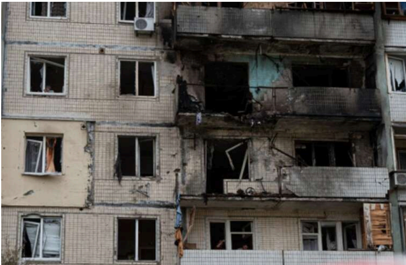
У лікарні перебувають двоє постраждалих внаслідок нічної російської атаки, - мер

Читати на руском Read in English Додати як бажане джерело в Google