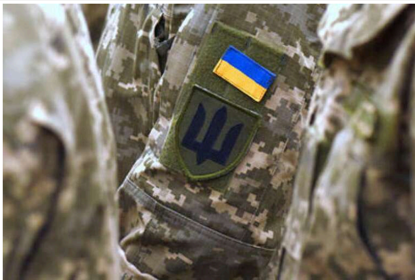
У Черкасах побили військового комісара під час перевірки документів, – обласний ТЦК

Читати на руськом Read in English Додати як бажане джерело в Google