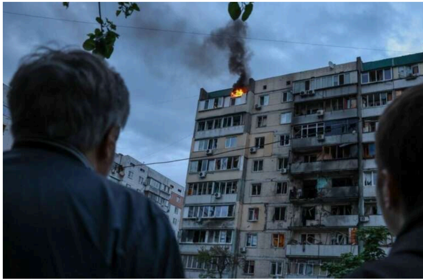
Зеленський прокоментував ворожий комбінований удар РФ по Україні

Президент Володимир Зеленський висловився щодо масованої повітряної атаки росіян на Україну. Він зазначив, що внаслідок удару є загиблі, постраждали щонайменше 7 регіонів.