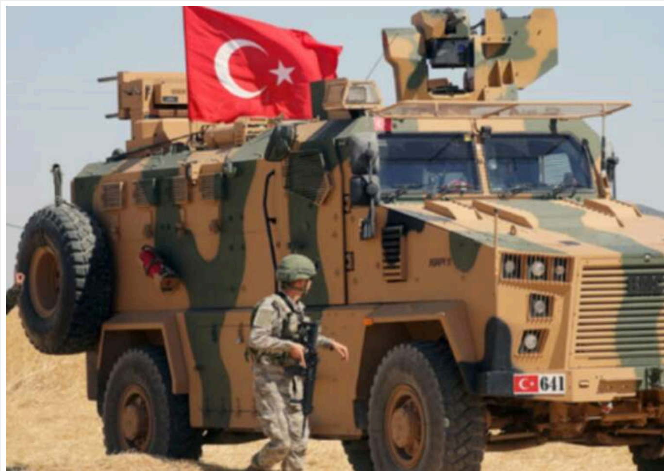
У Туреччині відбулися великі міжнародні військові навчання

Читати на руськом Додати як сховане джерело в Google