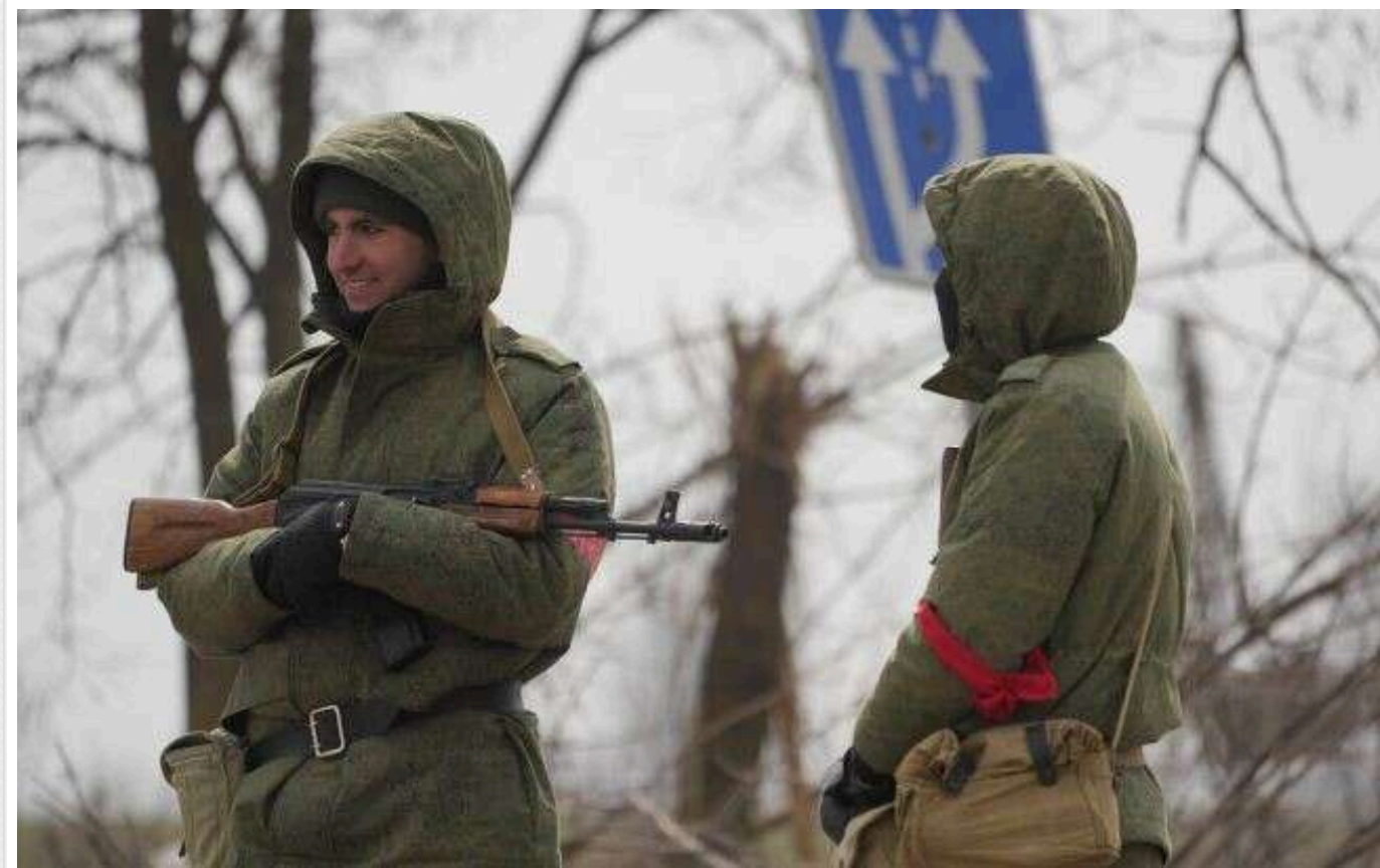
РФ готує «м'ясо без паспорта»: Держдума схвалила призов осіб без громадянства, включно з мешканцями окупованої Луганщини

У російській Держдумі в першому читанні схвалили законопроект, що дозволяє особам без громадянства підписувати контракт з армією та брати участь у бойових діях. Це може торкнутися і жителів окупованої Луганщини.