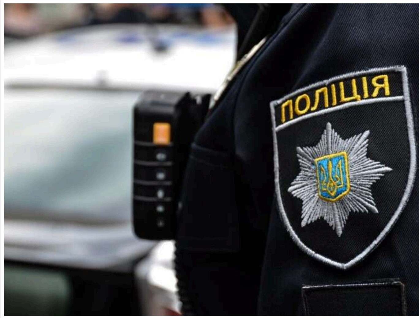
На Одещині чоловік «віджав» частину місцевого стадіону і побудував там басейн для сім'ї

Читати на руском Додати як бажане джерело в Google