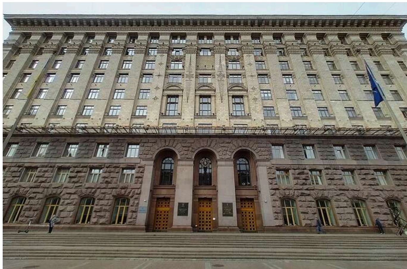
Друкарня за мільйон: Київрада купує супер-копір за 1,16 мільйона гривень із захистом даних і друком за кодом

Пристрій, що має багато функцій, також передбачає захист даних, а секретні документи друкує після введення коду.