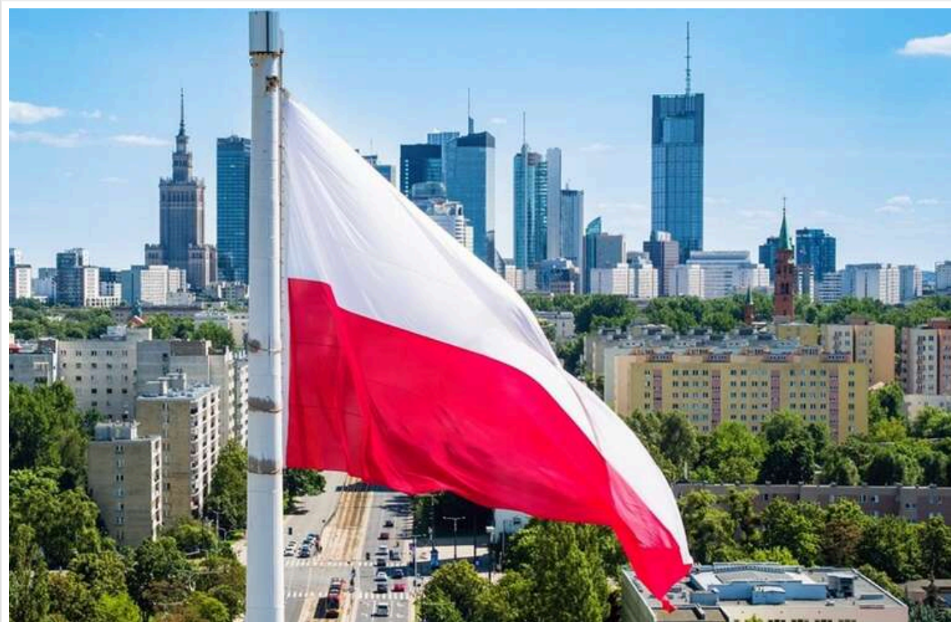
The Economist: Польща - новий «мушкетер» Європи з найшвидшим зростанням і армією потужнішою за британську

Британський журнал The Economist приділяє Польщі велику аналітичну увагу, відзначивши її стрімкий розвиток, зростаючий вплив у Європі та виклики, з якими країна стикається в контексті політичних виборів та глобальної нестабільності.