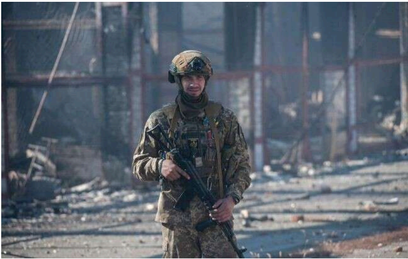
Ситуація на фронті: Протягом доби ворог провів 39 штурмових дій на Курському напрямку

З початку цієї доби, станом на 22:00, на фронті відбулося 150 бойових зіткнень.