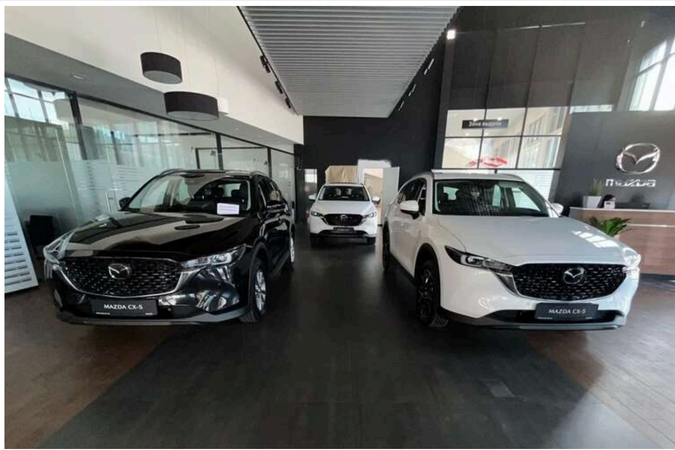
Mazda повернулася в РФ: відновила продаж автомобілів із заводської гарантією

На автомобіль надається гарантія 3 роки або 100 тис. км пробігу – залежно від того, що станеться раніше.