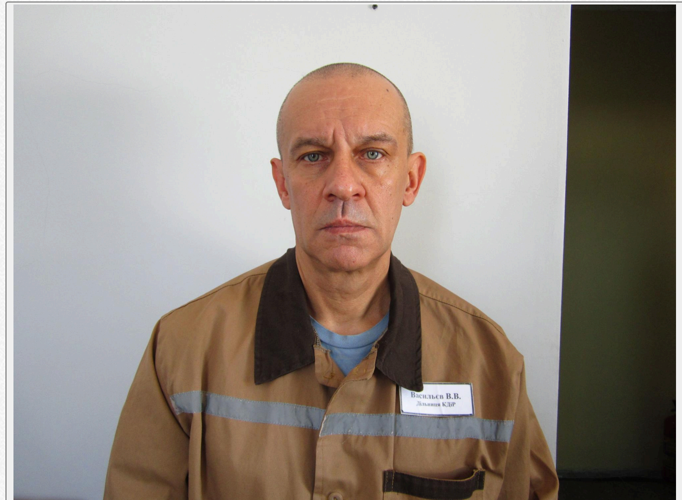
Фото: Віталій Васильєв (hochuksvoim.com)

Віталій Васильєв — був підполковником аналітичного відділу УСБУ в Луганську. У лютому 2020 року отримав паспорт так званої "ЛНР" і переїхав до Луганська. Там зустрівся з співробітником "МГБ ЛНР" і надав інформацію про співробітників СБУ, яких планували використовувати для підривної діяльності проти України.