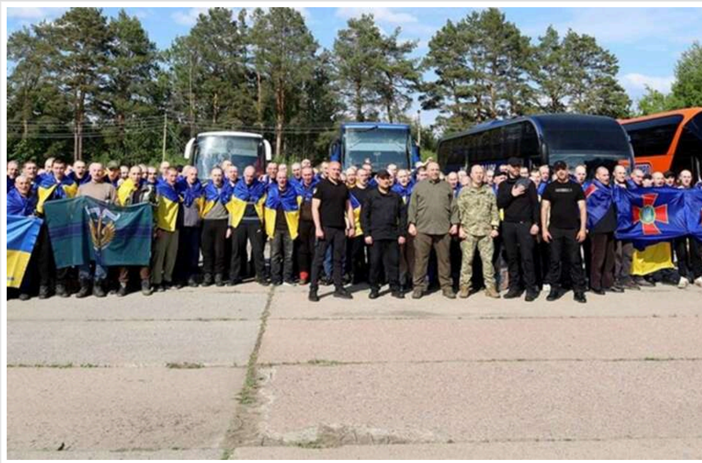
Яких колаборантів передали РФ у рамках обміну: соратник Медведчука, ексчиновник, колишній СБУшник

Читати на руском Read in English Додати як бажане джерело в Google