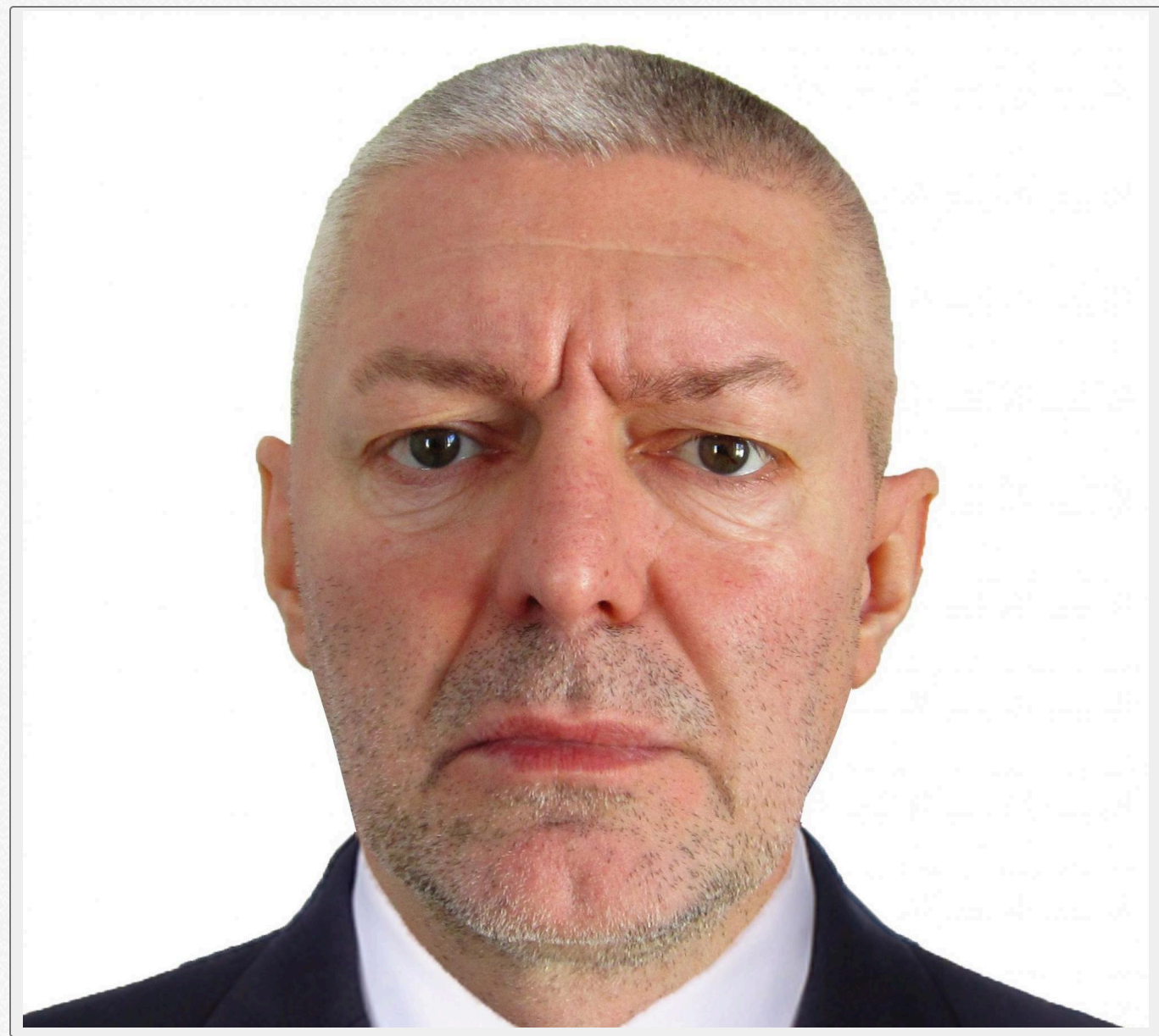
Фото: Василь Мехеда (hochuksvoim.com)

Василь Мехеда — колишній співробітник секретаріату Кабміну України. З 2006 року передавав російським спецслужбам секретні документи, включаючи матеріали з грифом "секретно".