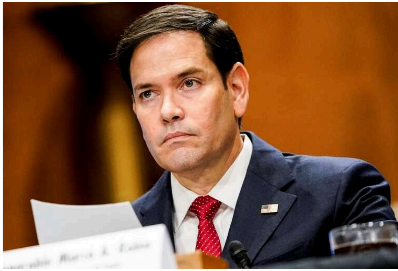
Рубіо наполягає на жорстких санкціях проти Росії, попри опір Трампа, – ЗМІ

Держсекретар США Марко Рубіо виступає за запровадження жорстких санкцій проти Росії, незважаючи на незгоду президента Дональда Трампа.