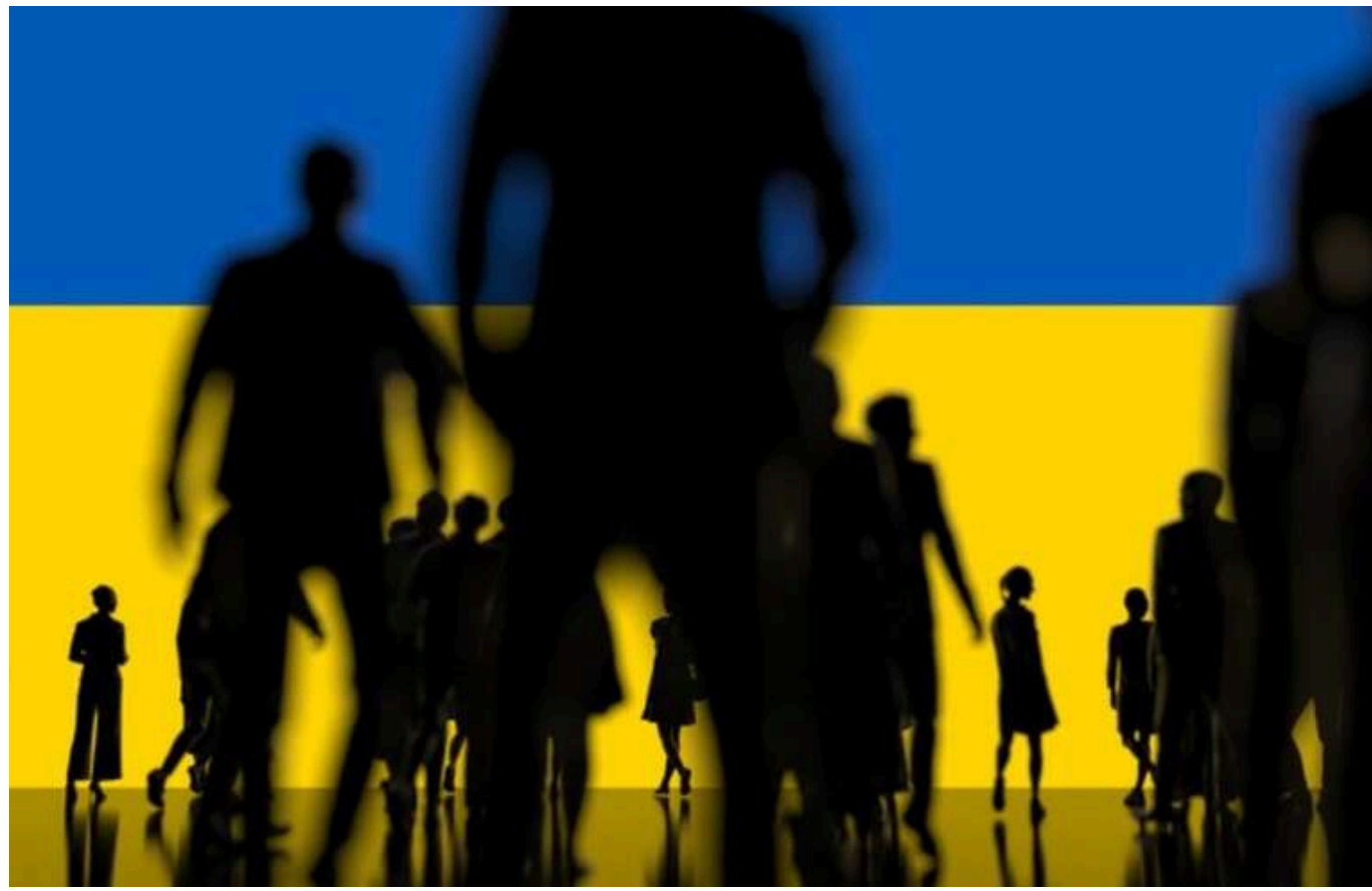
Єврокомісія очікує повернення частини українців на батьківщину вже в 2025 році

Читати на руском Read in English Додати як бажане джерело в Google