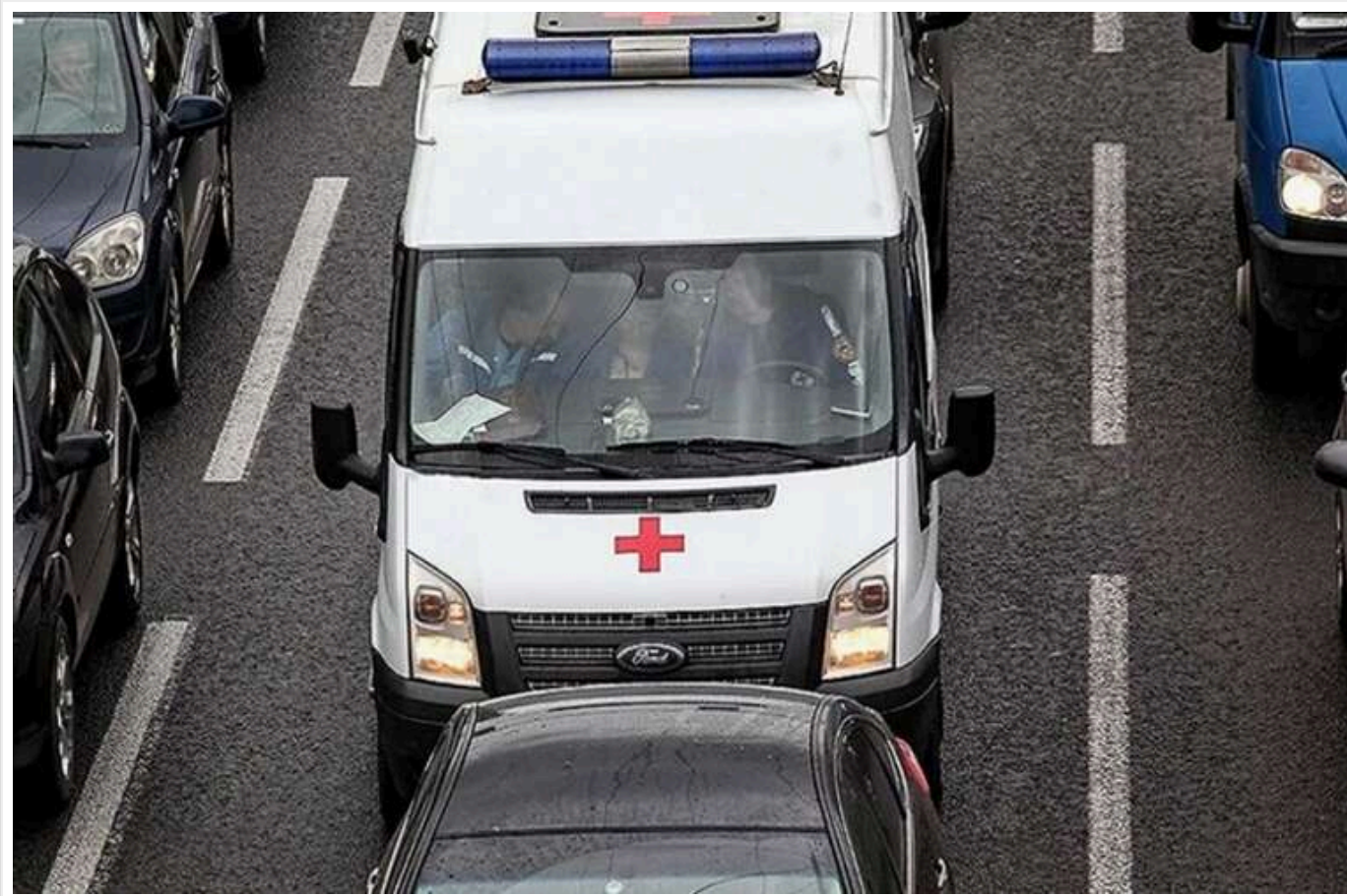
Штрафи за непропускання автомобілів екстрених служб можуть збільшитись до 51 тисячі гривень

В Україні планують суттєво посилити відповідальність за ненадання переваги в русі автомобілям екстрених служб.