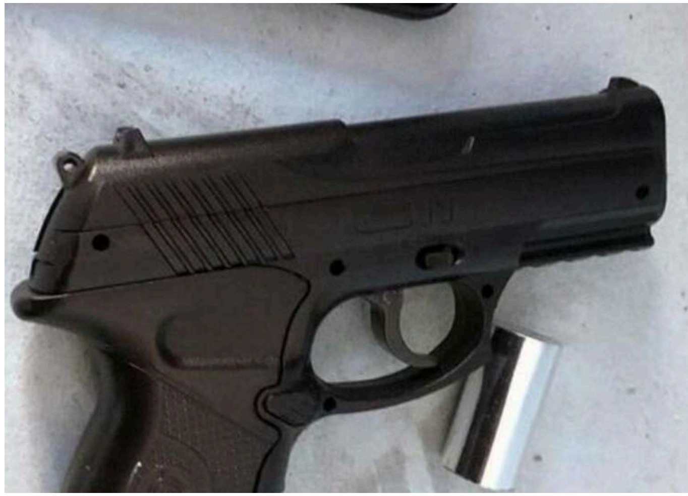
У Харкові військовий відкрив вогонь по підлітках через слово «ТЦКашник»: йому дали понад 3 роки

Салтівський районний суд Харкова виніс вирок у справі військовослужбовця, який 8 березня відкрив стрілянину по підлітках через нібито образу.