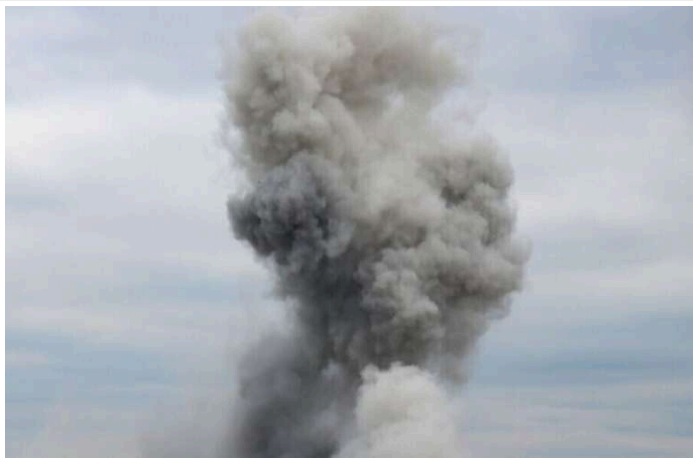
Атака на Одесу: у місті лунали вибухи, «шахеда» вдарили по передмістю, є поранений

Зранку 23 травня в Одесі пролунали вибухи – місто зазнало чергової атаки ворожих ударних дронів типу «Шахед».