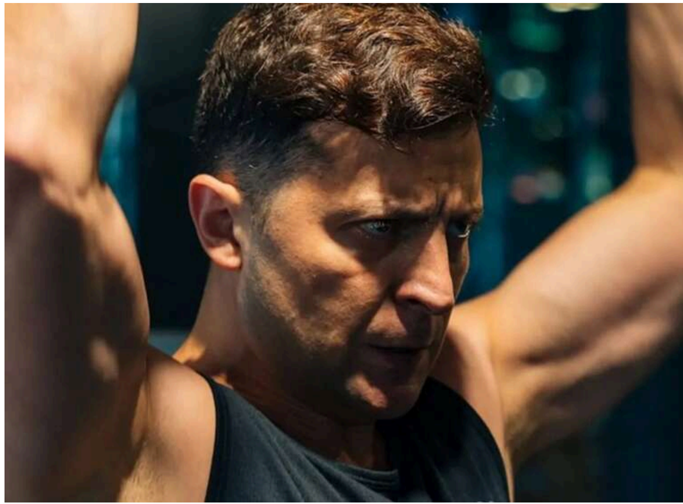
Зеленський зізнався, скільки разів може підтягнутися: "47 не вийде, але 12–15 – так"

Глава держави Володимир Зеленський здатний підтягнутися близько 15 разів.