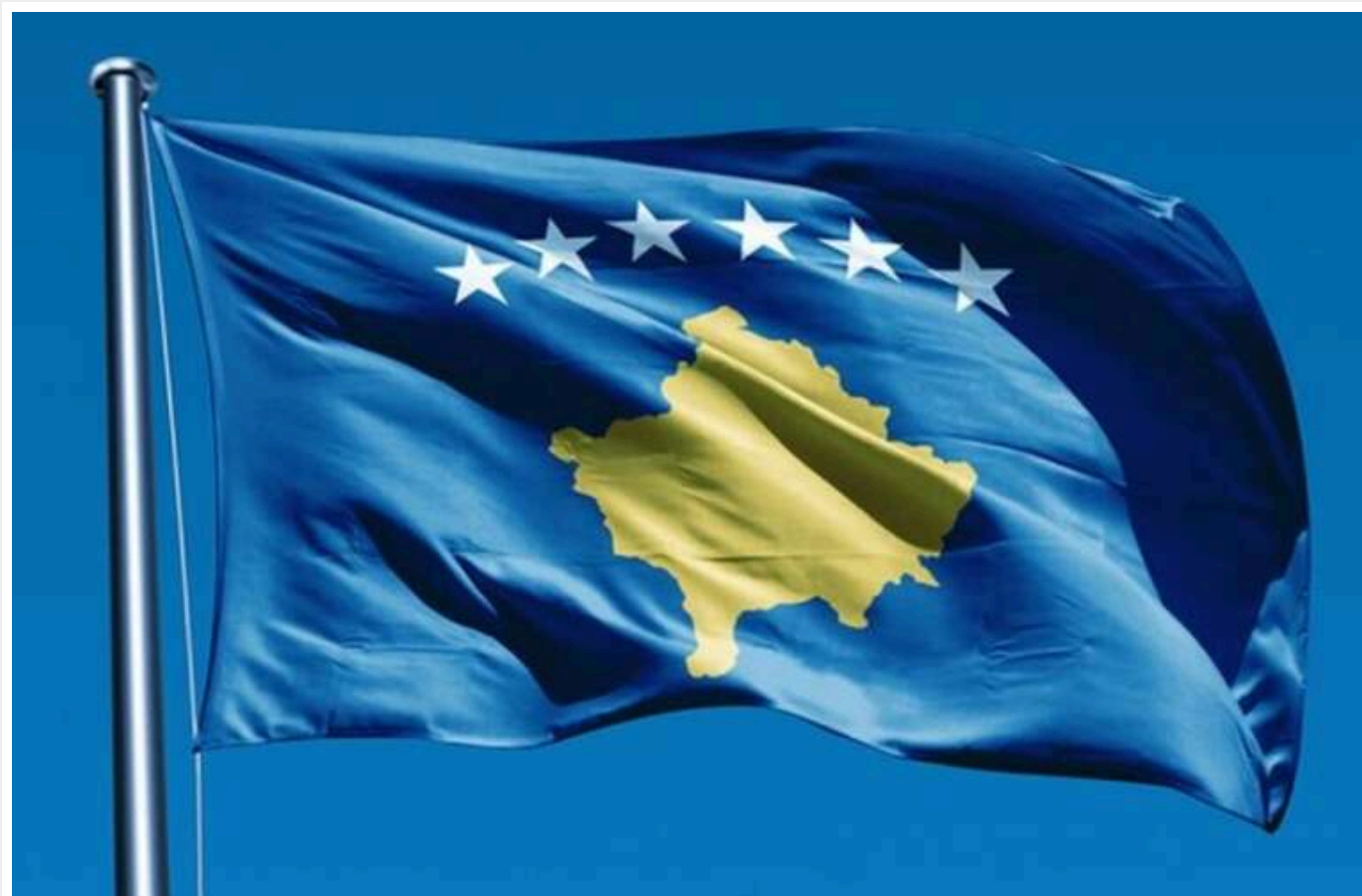
ЄС оголосив, що розпочав процедуру зняття санкцій із Косова

Кая Каллас, головна дипломатка Європейського Союзу, оголосила про початок зняття санкцій із частково визнаного Косова, накладених через нестабільність у північних муніципалітетах країни з переважно сербським населенням.