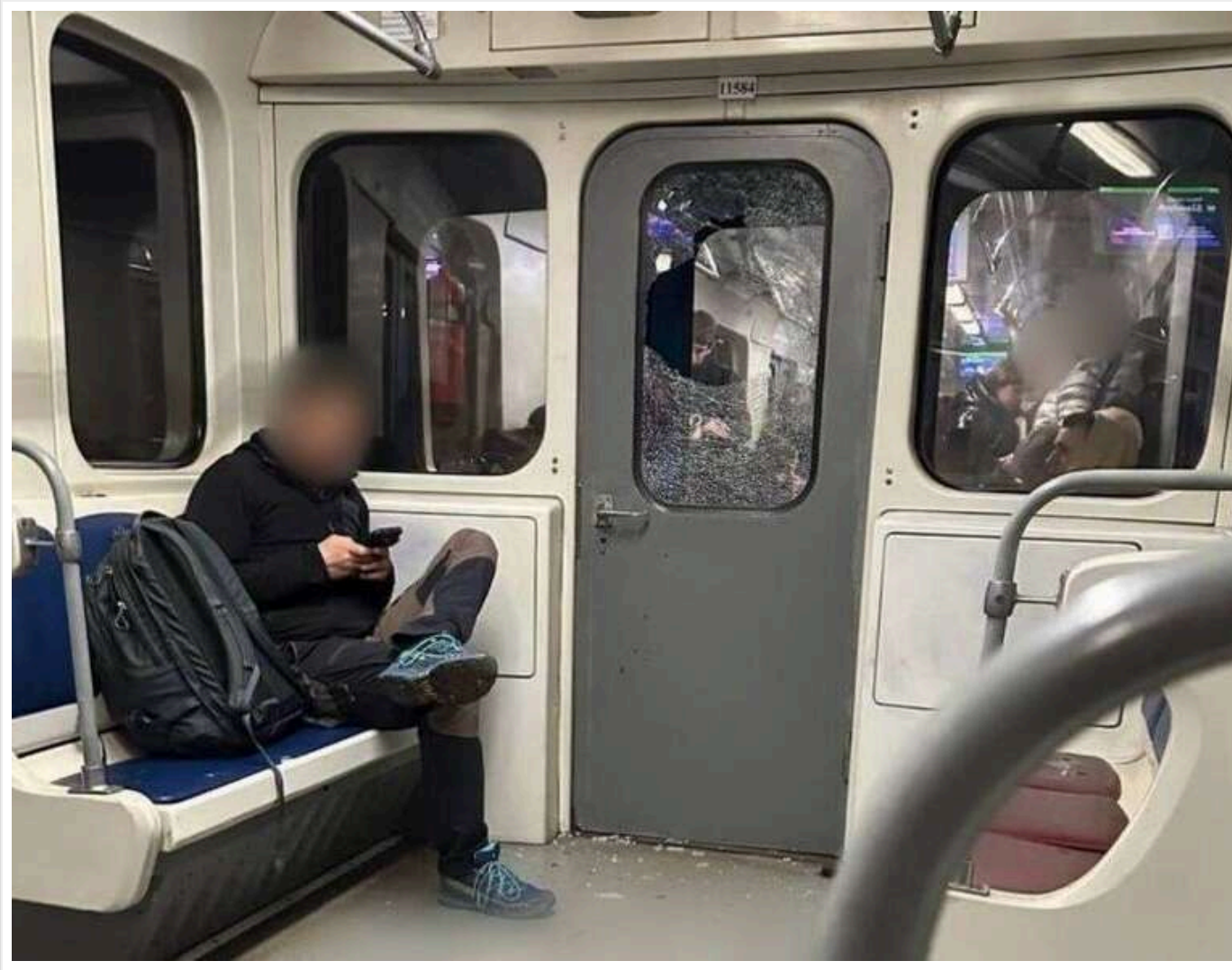
П'яний 19-річний киянин розбив вікно в метро, намагаючись перейти в сусідній вагон - йому загрожує до 5 років

Житель Києва під впливом алкоголю розбив вікно у вагоні метро, нібито для того, щоб потрапити до сусіднього вагона. Надзвичайна пригода у транспорті сталася напередодні, у середу, 21 травня 2025 року, причому поліція досить швидко виявила винуватця. Відео з розбитим склом та молодиком, який спричинив безлад, слідчі побачили у соцмережах.