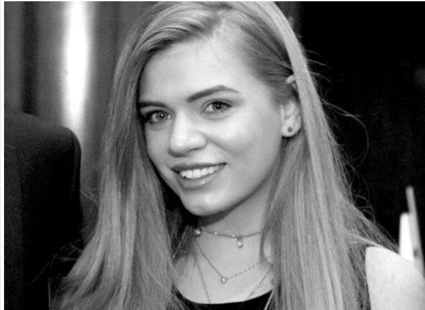
Звільнена чиновниця з Одеської області задекларувала майно на 23 мільйони гривень із порушеннями, - НАЗК

Читати на руском Read in English Додати як бажане джерело в Google