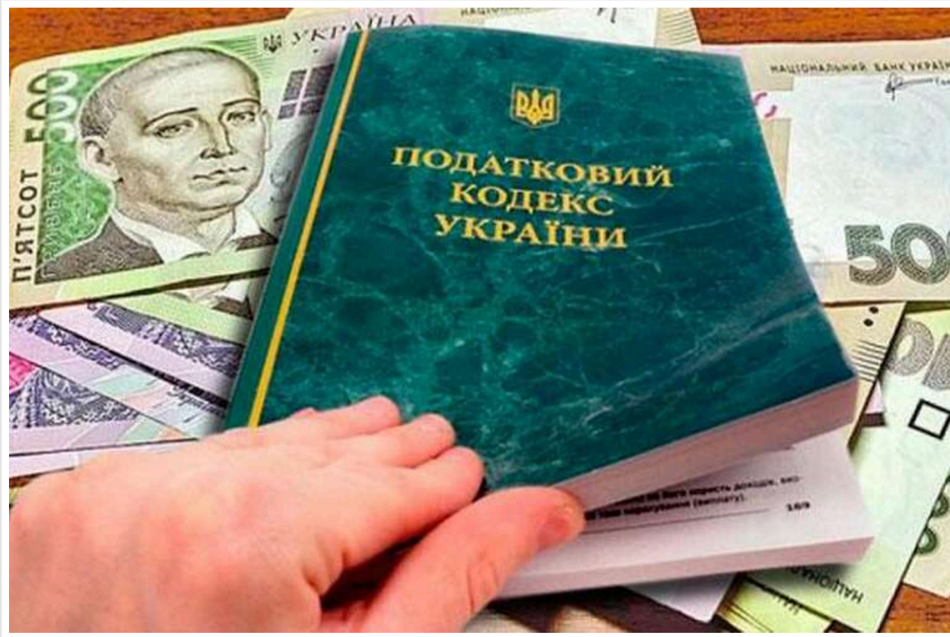
Мінекономіки: підприємства з філіями можуть позбутися статусу критичності без податкової виписки до 28 травня

Деякі компанії можуть втратити статус критичності, якщо до 28 травня не нададуть виписку з податкової.