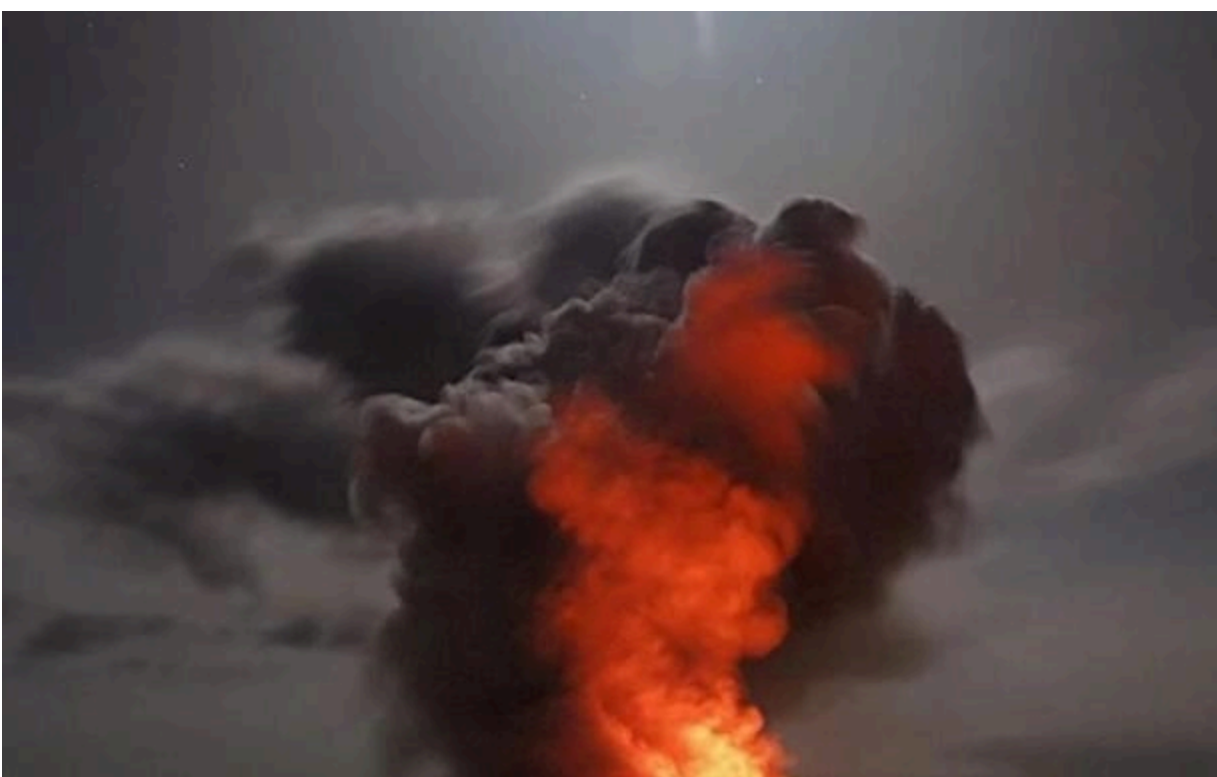
Фото: Соцмережі (ілюстративне фото) У Севастополі уражено військовий об'єкт Чорноморського флоту РФ - ВМС

Завдано ракетного удару береговим ракетним комплексом Нептун. Внаслідок ураження знищено місця зберігання озброєння та військової техніки Чорноморського флоту РФ. Військово-морські сили ЗСУ повідомили , що в бухті Стрілецька м. Севастополь у тимчасово окупованому Криму у ніч на 11 червня було уражено військовий об'єкт РФ.