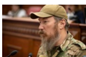
"Мадяр" озвучив плани щодо ізоляції Криму від РФ