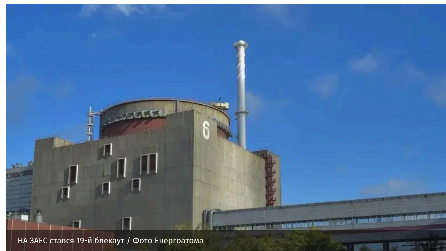
На ЗАЕС стався 19-й блекаут

На тимчасово окупованій Запорізькій атомній електростанції ввечері 10 червня сталося повне знеструмлення. Це вже 19-й блекаут на об'єкті від початку повномасштабного вторгнення Росії в Україну.