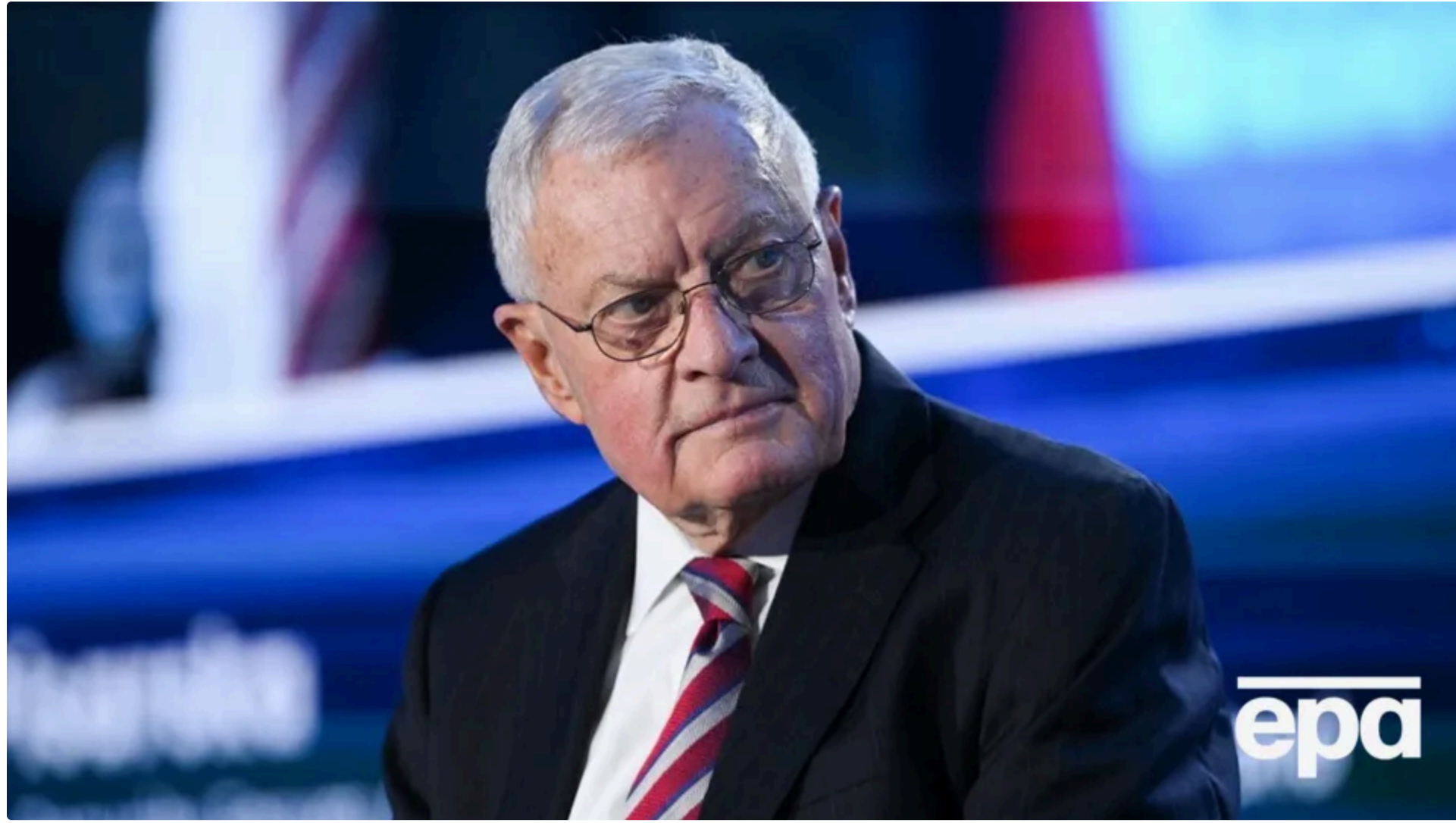
Келлог розповів, чому призупинення переговорів може піти на користь

Колишній спеціальний посланник президента США Дональда Трампа Кіт Келлог вважає, що процес переговорів між Україною, США та країною-агресором Росією "фактично призупинено" і, на його думку "добре". Про це він заявив у коментарі "Суспільному" , оприлюдненому 11 червня.