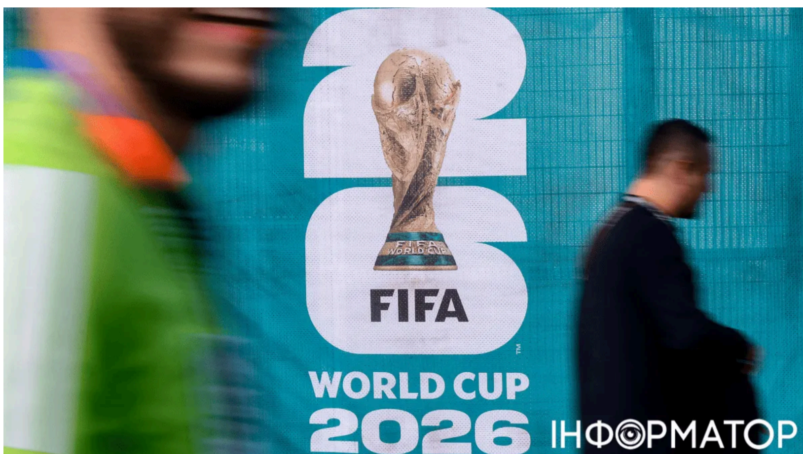
Матчі ЧС-2026 12 червня - розклад і прогнози, колаж: Інформатор

Чемпіонат світу 2026 року дарує уболівальникам два повноцінних групових поєдинки. Інформатор раніше детально розповідав про арені та матч-відкриття Мундіалю, який відбувся 11 червня у Мексиці. 12 червня черга стартowego поєдинку для Південної Кореї та Чехії - вранці, а ввечері на поле виходять Канада і Боснія та Герцеговина. Обидва матчі мають вирішальне значення для розподілу сил у групах А і В.