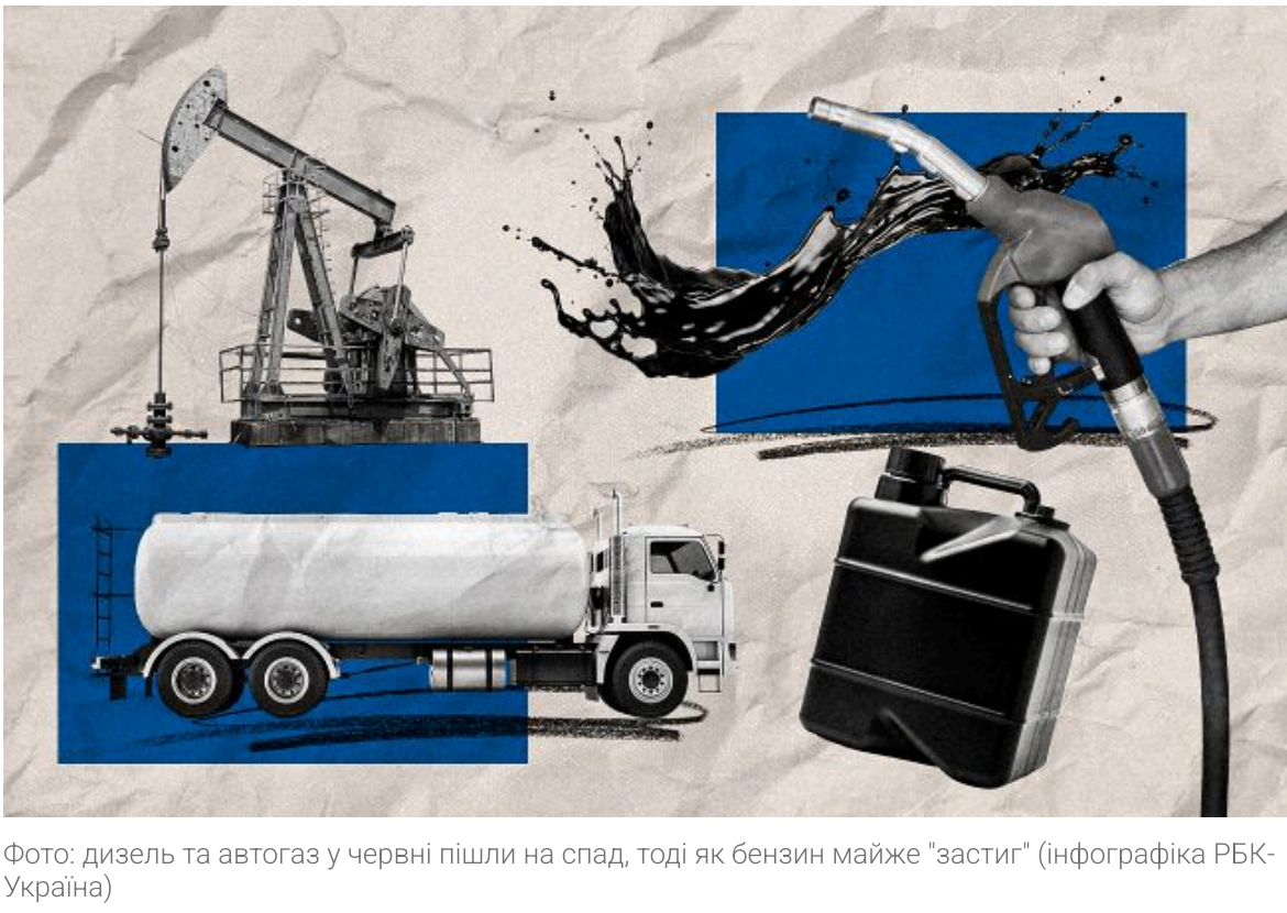
Фото: дизель та автогаз у червні падали на стелі, тоді як бензин майже "застій" (інфографіка РБК-Україна)

Не витрачай час на шум! Читай тільки суть з РБК-Україна у Google