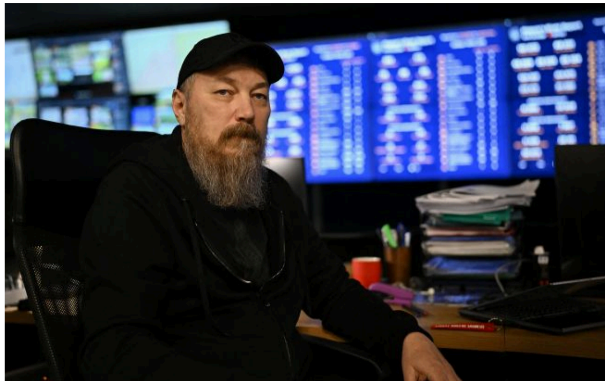
Фото: Роберт "Мадяр" Бровді (GettyImages)