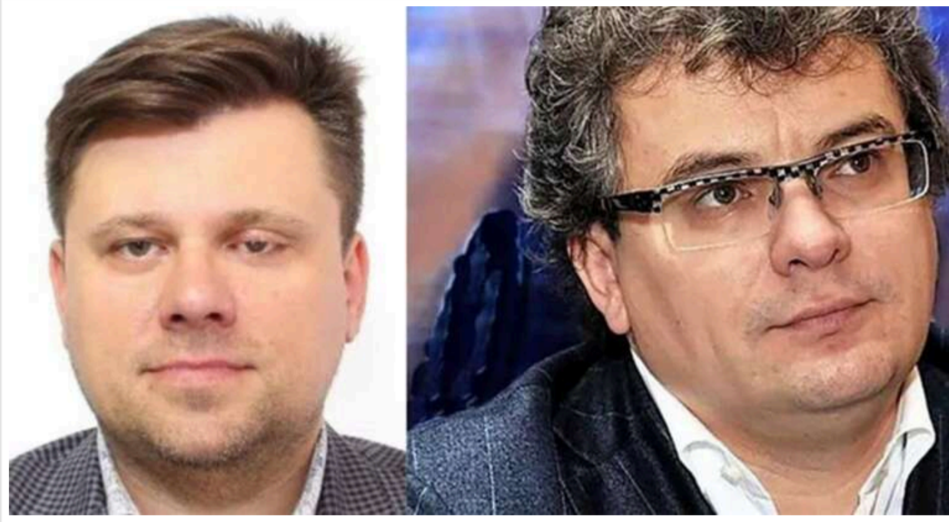
Олег Міщенко та Владислав Дрегер хочуть стати монополістами у сфері пасажирських перевезень, «віджимаючи» автопідприємства

Олег Міщенко, спілник і партнер "короля обналу" В'ячеслава Стрелковського, разом із відомим українським рейдером Владиславом Дрегером хочуть стати монополістами у сфері пасажирських перевезень. Для цих цілей вони здійснюють рейдерські захоплення об'єднань автостанцій для акумуляції потоків чорної готівки, передає Front-UA.