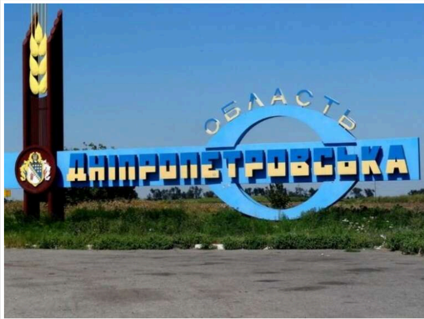
У Дніпропетровській ОВА спростували фейкову інформацію про досягнення росіянами кордону області

Читати на руском Read in English Додати як бажане джерело в Google