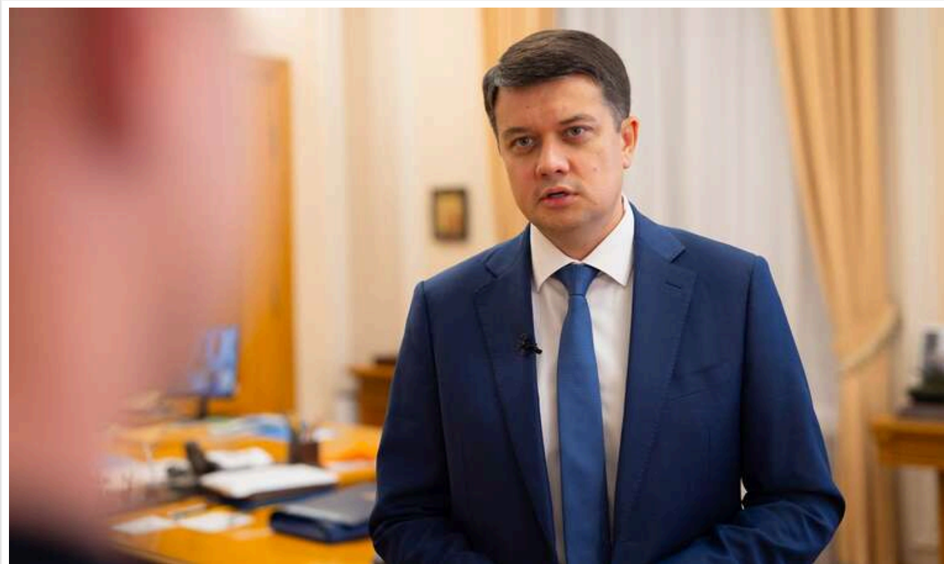
До осені на армію в бюджеті буде дірка в 500 мільярдів гривень, - Разумков

Читати на руськом Read in English Додати як бажане джерело в Google