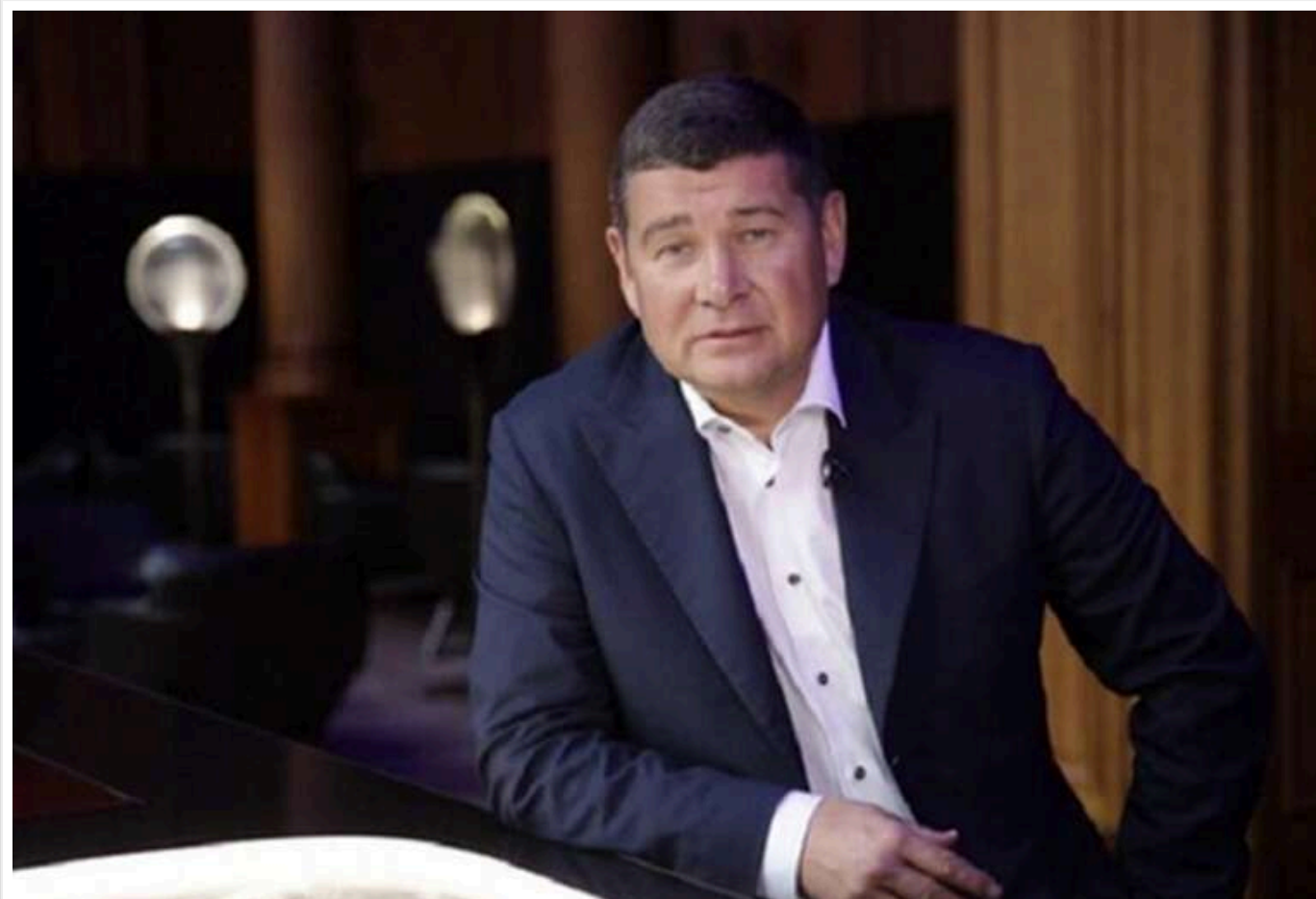
ВАКС скасував вирок ексдепутату-втікачу Онищенко, який був засуджений до 15 років по «газовій справі»

Читати на руском Read in English Додати як бажане джерело в Google