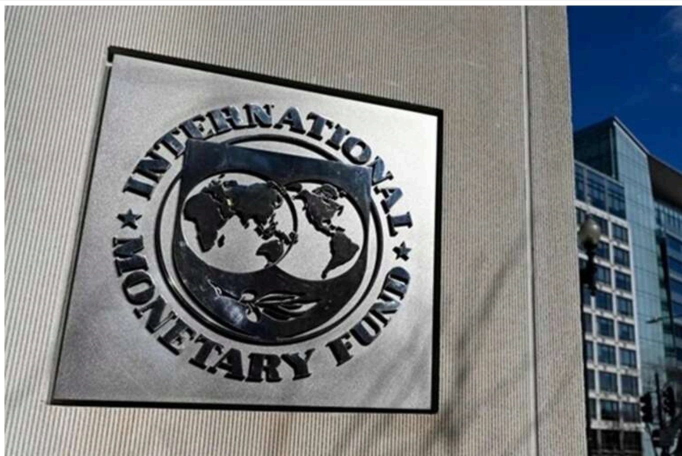
Місія МВФ почала восьмий перегляд програми розширеного фінансування (EFF) з Україною

Читати на руском Read in English Додати як бажане джерело в Google