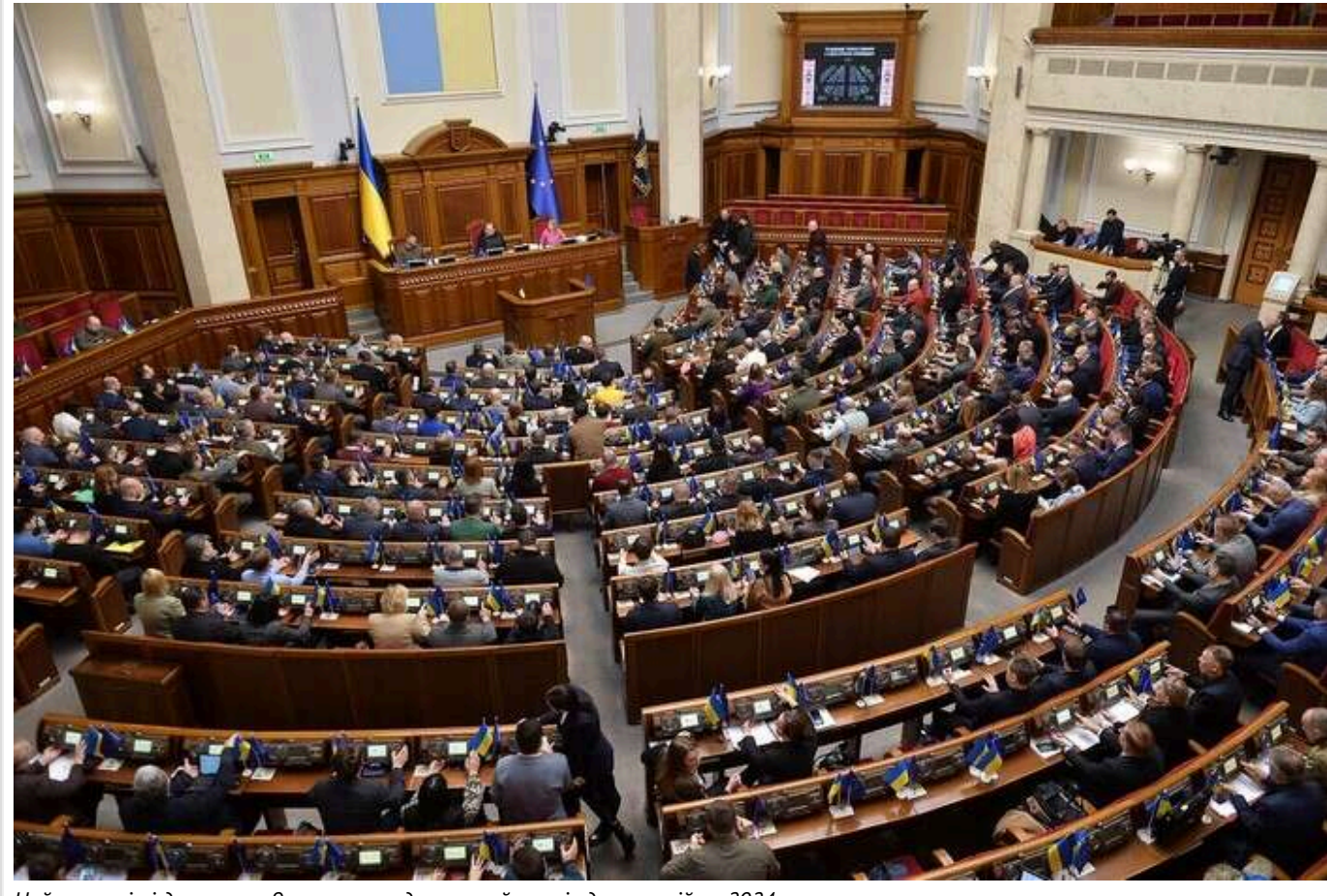
Найважливіші депутати 9 скликання: детальний аналіз декларацій за 2024

Аналітики R&D-центру YouControl проаналізували декларації народних депутатів за 2023–2024 роки. І визначили, хто з народних обранців 9 скликання має найбільший дохід, арахуючи вже перелік фракцій та депутатських груп. Також порохували відсоток зростання та спадання доходів депутатів порівняно з попереднім періодом. А ще визначили їхні зв'язки з корпоративними групами.