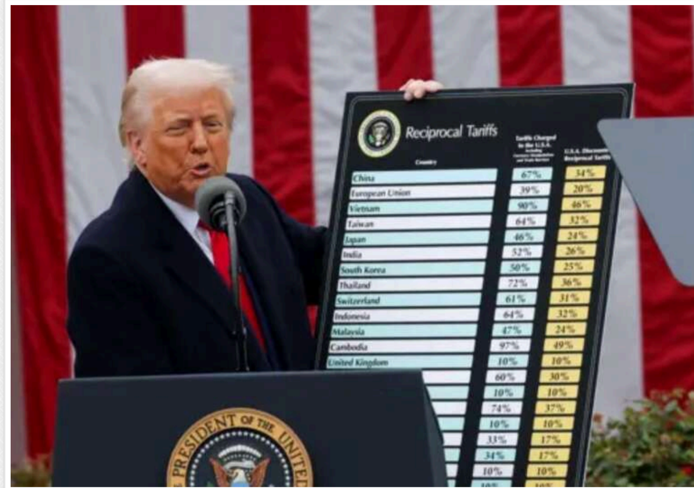
Тарифи Трампа б'ють по кишенях американців: адміністрація визнала зростання цін для населення

Адміністрація Трампа визнала, що саме американці платять за тарифи, введені президентом. Це сталося після того, як компанія Walmart оголосила про підвищення цін, посиляючись на вплив тарифів.