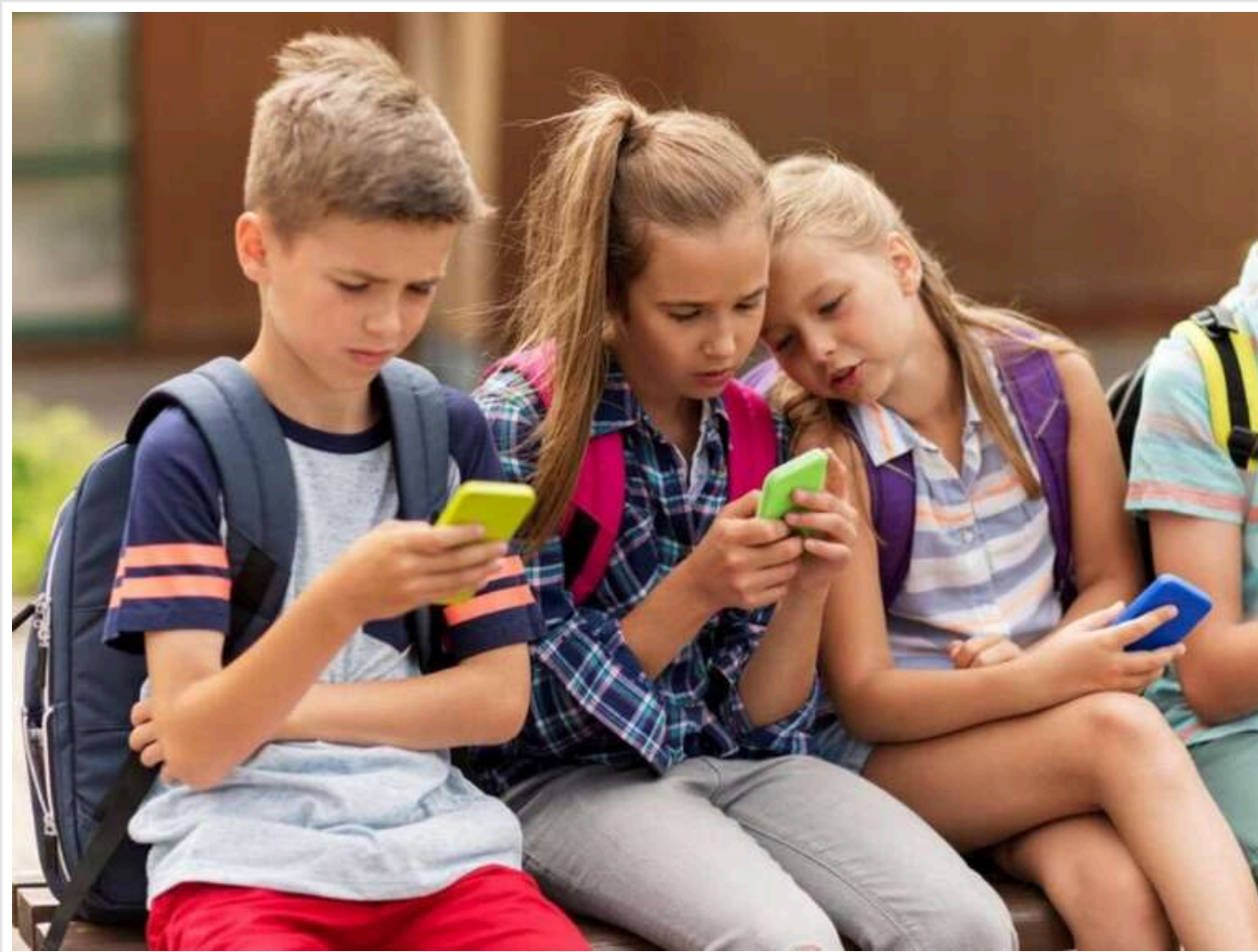
У ЄС розглянуть можливість запровадження загальноєвропейських вікових обмежень для доступу до соціальних мереж - Politico

Європейській Союз розглядатиме встановлення загальноєвропейського віку цифрової зрілості, нижче якого неповнолітні потребуватимуть згоди батьків для доступу до соціальних мереж. Цю пропозицію обговорять профільні міністри на зустрічі на початку червня.