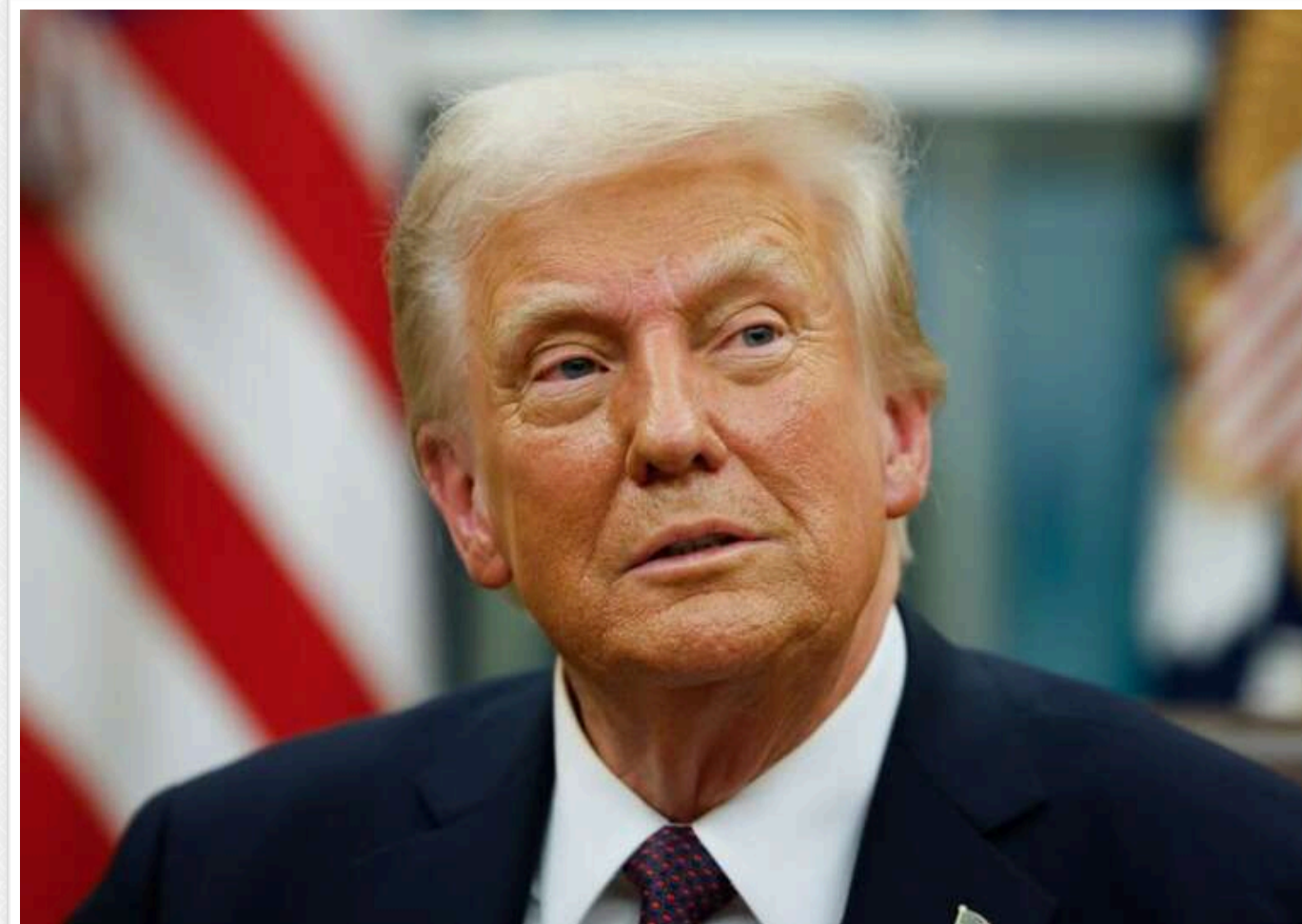
Трамп не виключає збільшення військової допомоги Україні, але підкреслює «червону лінію»

Президент США Дональд Трамп повідомив, що розглядає варіант збільшення військової підтримки України, хоча все ще сподівається на мирне вирішення конфлікту з Росією.