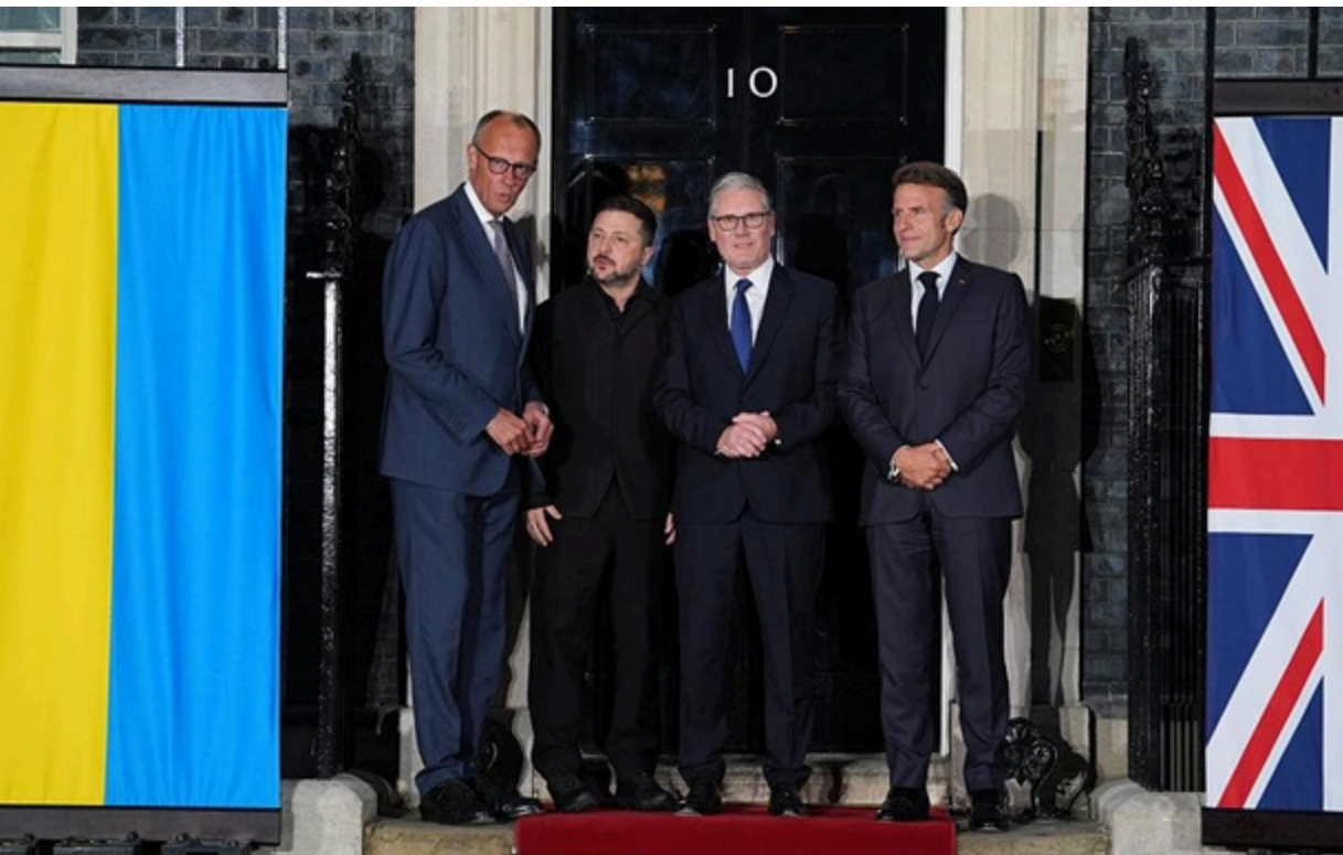
Лідери ФРН, України, Британії і Франції під час зустрічі у Лондоні 7 червня

Європейські дипломати виклали основні положення заяви лідерів країн євротрійки від 7 червня.