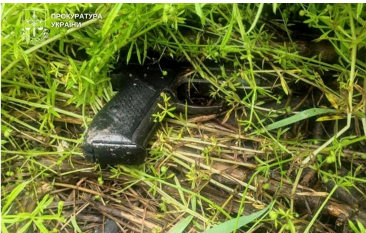
Фігурант стріляв у своїх знайомих

Убиті також є громадянами Грузії, один з них притягався до кримінальної відповідальності за квартирні крадіжки.