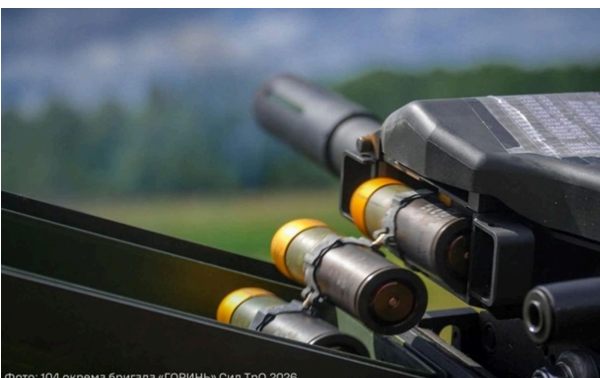
Фото: 104 окрема бригада «ГОРИНЬ» Сил ТрО, 2026 Наші захисники ведуть вогонь з автоматичного гранатомета МК-19

Майже половину своїх атак ворог сконцентрував в районі Покровська. Зараз там точаться чотири боєзіткнення.