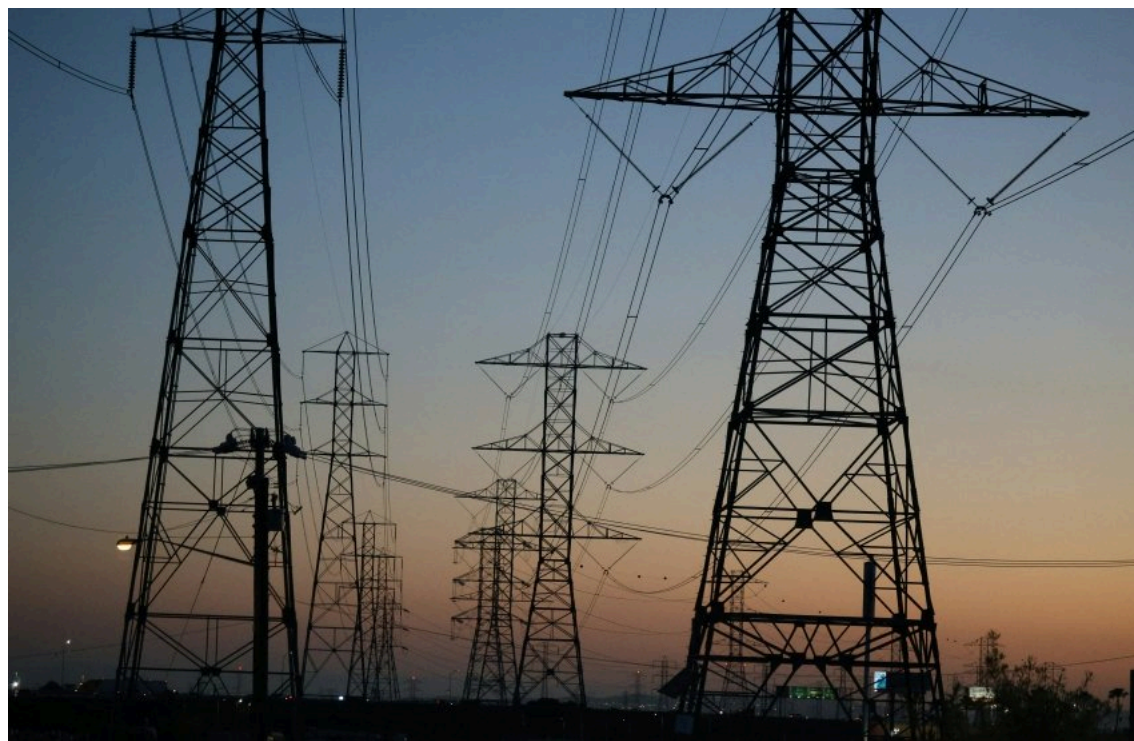
Регулятор змінив правила ринку після рекомендацій АМКУ

Національна комісія, що здійснює державне регулювання у сферах енергетики та комунальних послуг (НКРЕКП) затвердила зміни до Правил ринку електроенергії, які враховують рекомендації Антимонопольного комітету України. Йдеться про порядок поновлення договорів про врегулювання небалансів електричної енергії для учасників балансуєчючих груп.