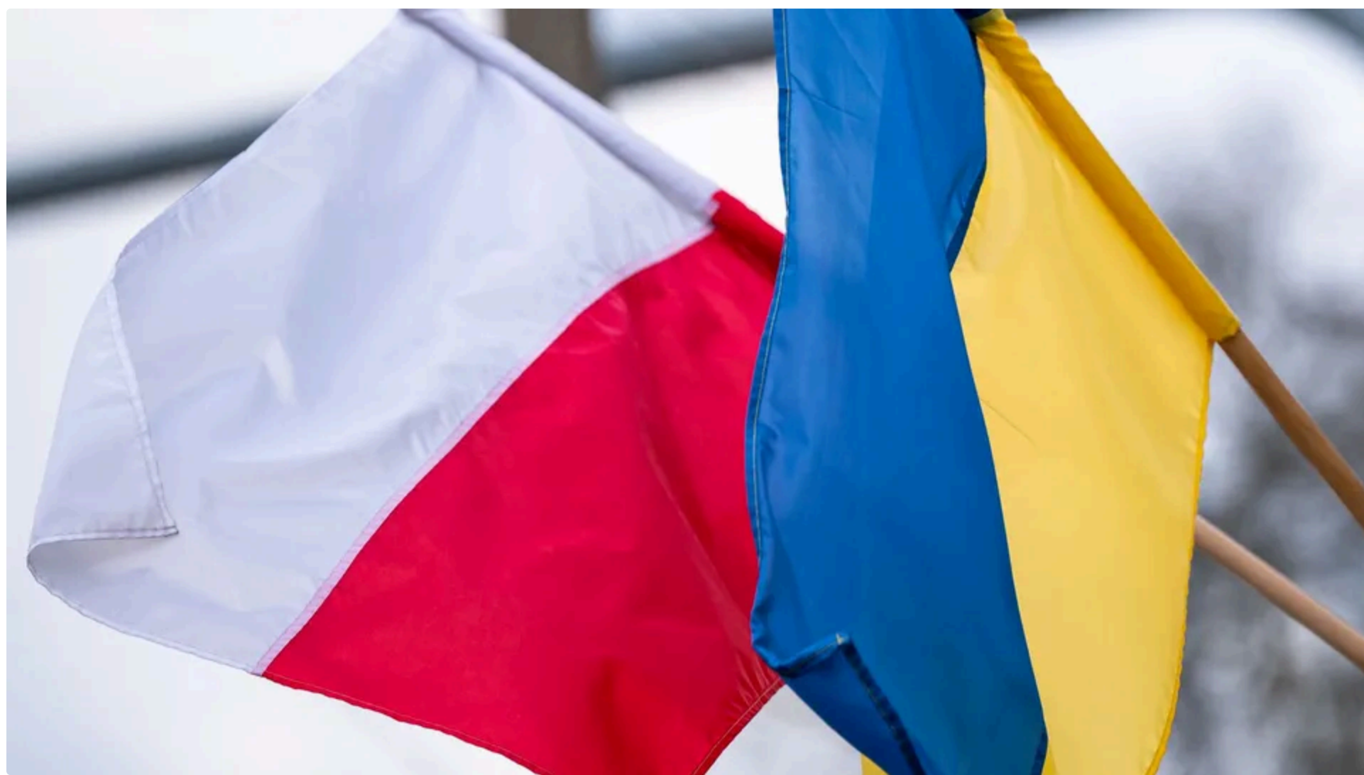
Польща вимагає повернення €450 млн за зброю для України

Між країнами Європейського союзу виникла суперечка щодо розподілу €6,6 млрд із Європейського фонду миру, розблокованих після зняття Угорщиною вето на підтримку України. Про це 10 червня поінформувало польське видання RMF24 .