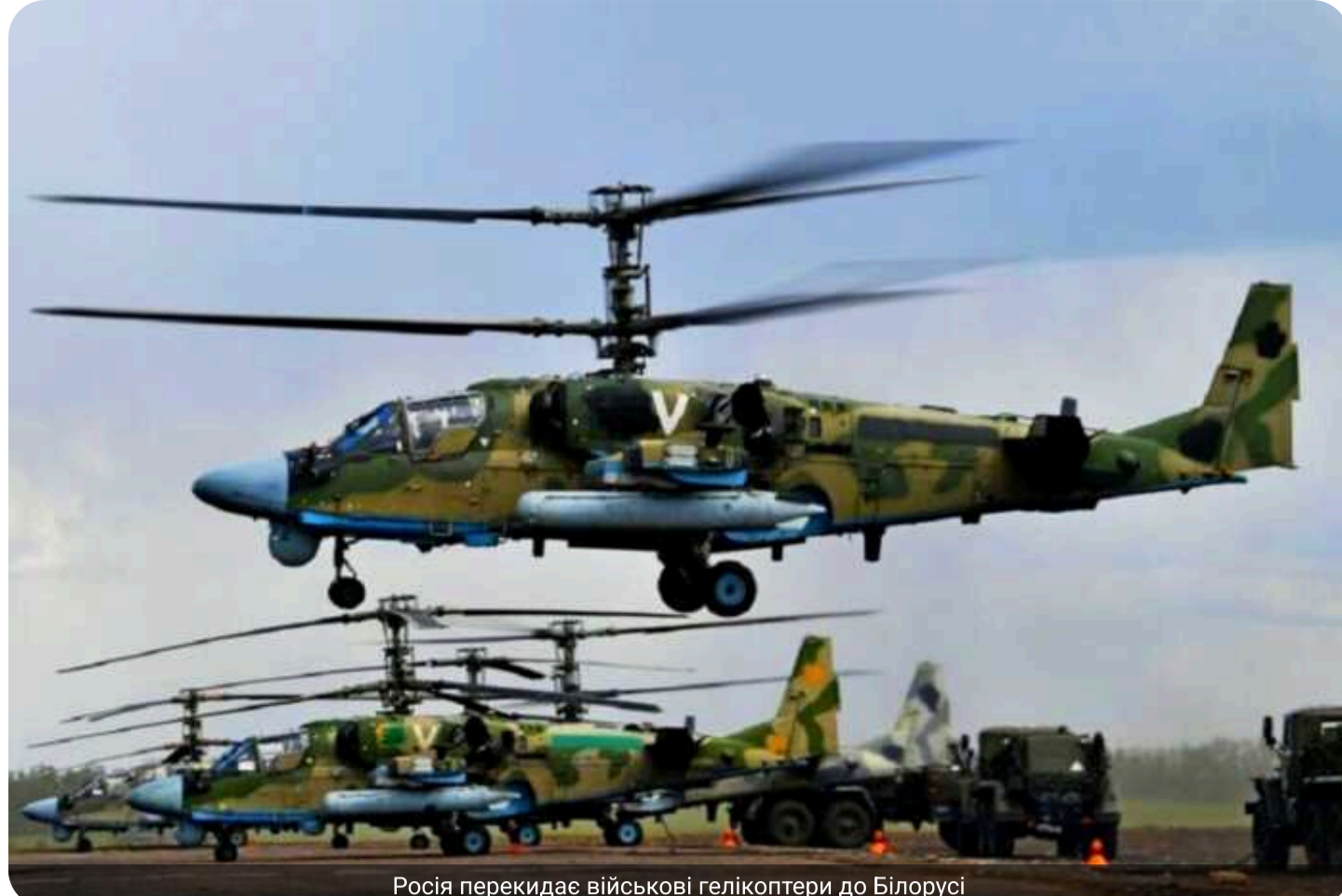
Росія перекидає військові гелікоптери до Білорусі

За даними моніторингових ресурсів, РФ здійснює перекидання військових гелікоптерів різних типів на територію Білорусі.