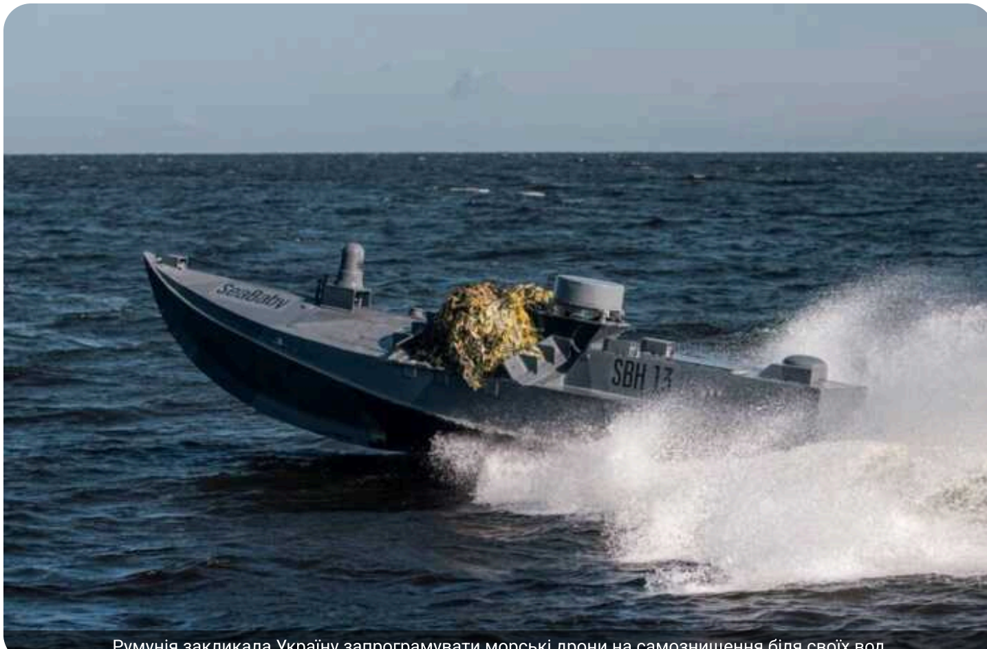
Румунія закликала Україну запрограмувати морські дрони на самознищення біля своїх вод

Міністр оборони Румунії Раду Міруца заявив, що українські морські дрони повинні автоматично самознищуватися у разі втрати керування та наближення до територіальних вод Румунії.