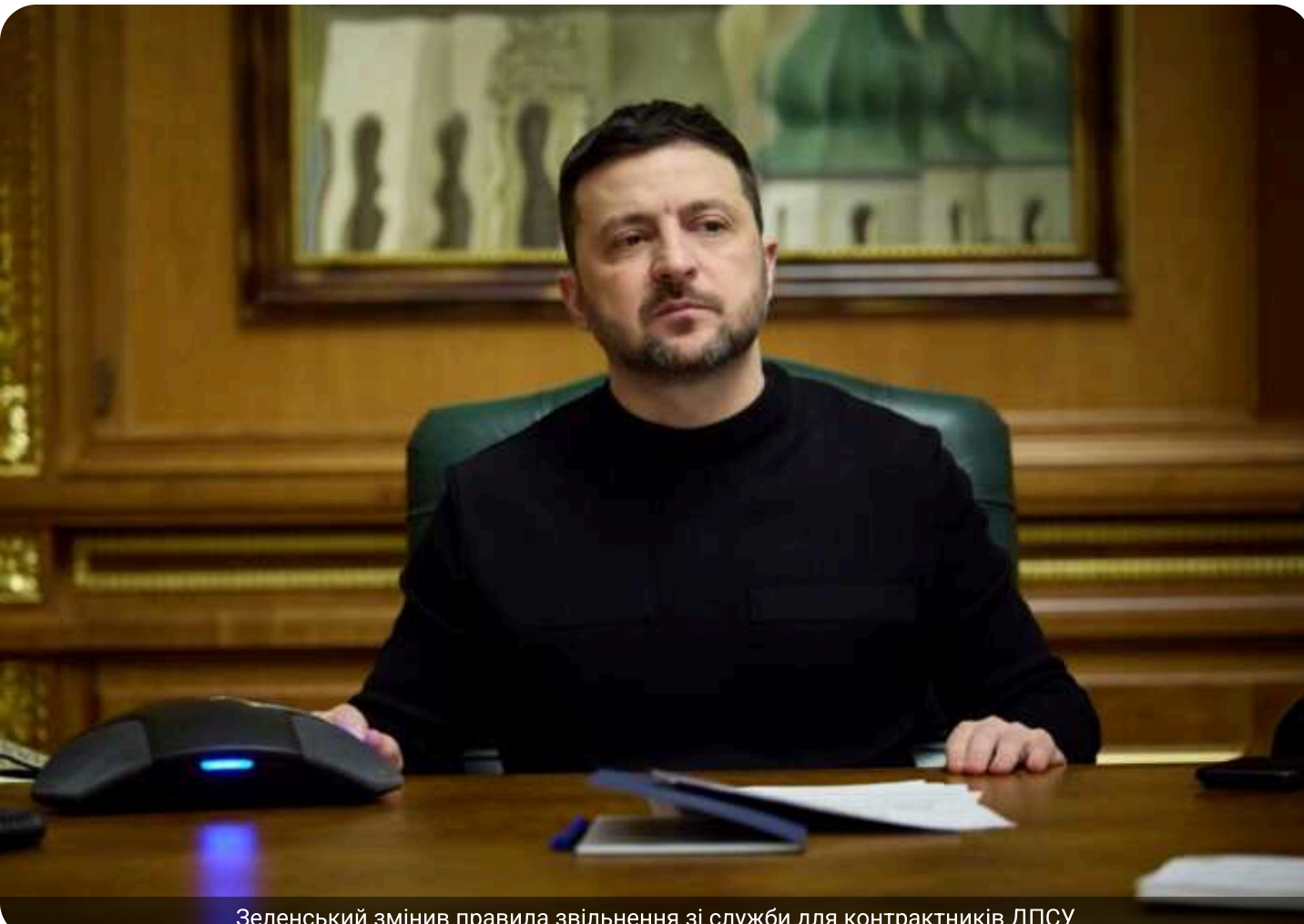
Зеленський змінив правила звільнення зі служби для контрактників ДПСУ

Президент Володимир Зеленський вніс зміни до Положення про проходження громадянами України військової служби в Державній прикордонній службі України.